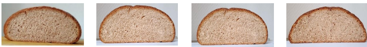
а до замораживания (контроль); б замораживание до -6^{\circ}\text{C} в центре заготовки в замораживание до -12^{\circ}\text{C} в центре заготовки г замораживание до -18^{\circ}\text{C} в центре заготовки